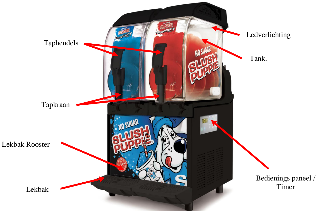
Bedienings Paneel /